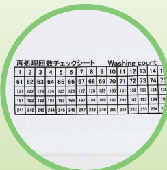
再処理回数シート