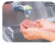
液状の石けんが吐出。