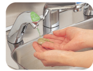
液状の石けんが吐出。