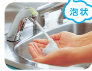
泡状の石けんが吐出。