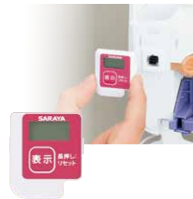
UD-9600専用 ディスペンサー用 カウンター

ノズル先端から床への薬液落ちを防止 するために取り付ける専用のトレーです。 ※サイズ:W91xD109xH124mm