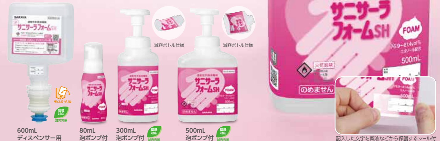
600mL ディスペンサー用