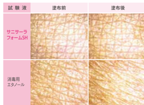
図2 各試験液塗布前後のマイクロスコープ画像

サニサーラフォームSHを1日10回塗布した被験者10名(男性5名、女性5名)の皮ふの状態を塗布前後においてマイクロスコープを用いて観察しました。対照として消毒用エタノールでも同様に試験しました。消毒用エタノールでは塗布後に皮ふのキメが大幅に低下している被験者が確認された(10名中6名)のに対し、サニサーラフォームSHは全ての被験者において変化は見られませんでした。