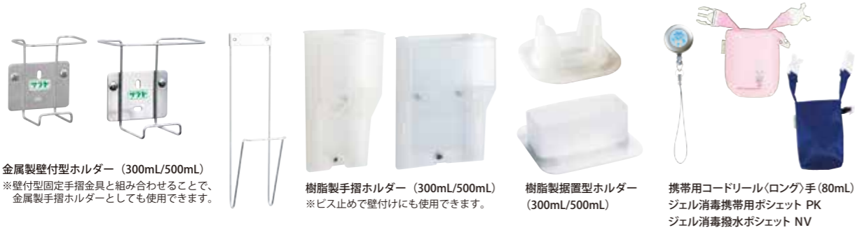
金属製壁付型ホルダー (300mL/500mL) ※壁付型固定手摺金具と組み合わせることで、 金属製手摺ホルダーとしても使用できます。

オプション品と組み合わせて使用することで、いつでもどこでも手指衛生ができます。 手指衛生の遵守率向上をサポートするため、携帯用品やホルダーを豊富にご用意しております。