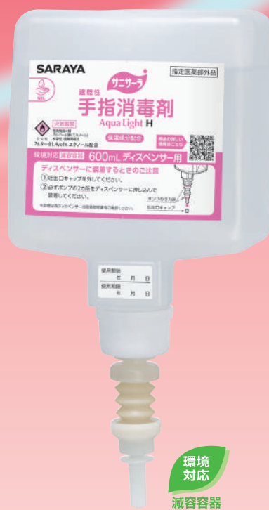
600mLディスペンサー用