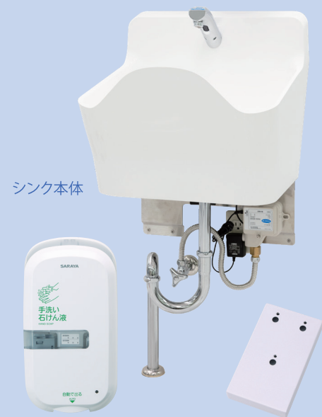
シンク本体 ノータッチ式ディスペンサー UD-9600RS ディスペンサー取付板