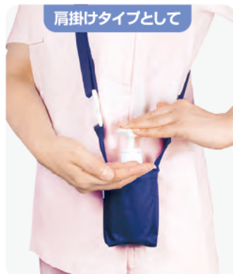
肩掛けタイプとして