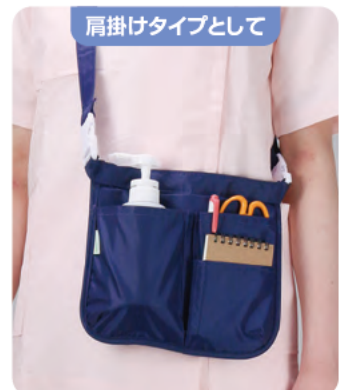
肩掛けタイプとして