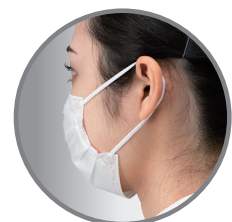
サージカルマスクEx