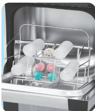
収納例：シャワーボトル(4本)