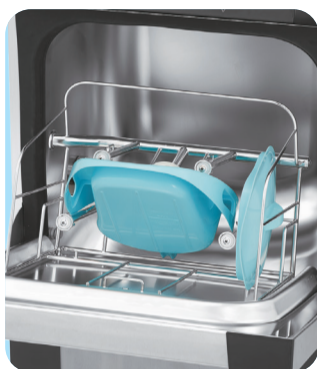
収納例：差込用便器