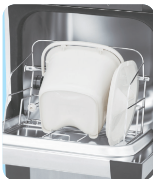
収納例：バケツ(高さ25cm)

主な洗浄用具 ● ベッドパン ● 差込用便器 ● ポータブルトイレ用バケツ ● 尿器 ● シャワーボトル ● 膿盆 ● ガーグルベース