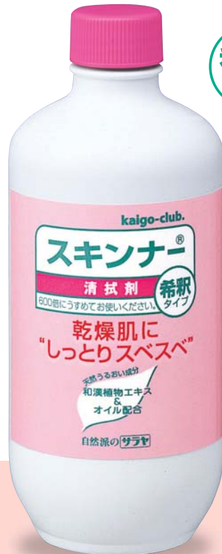
清拭剤 スキンナー 470mL